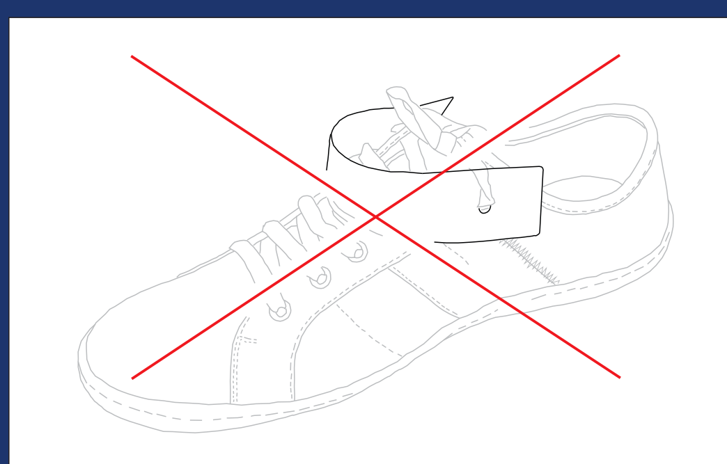
Forma de cabresto

Não funciona se o chip não for usado no pé.